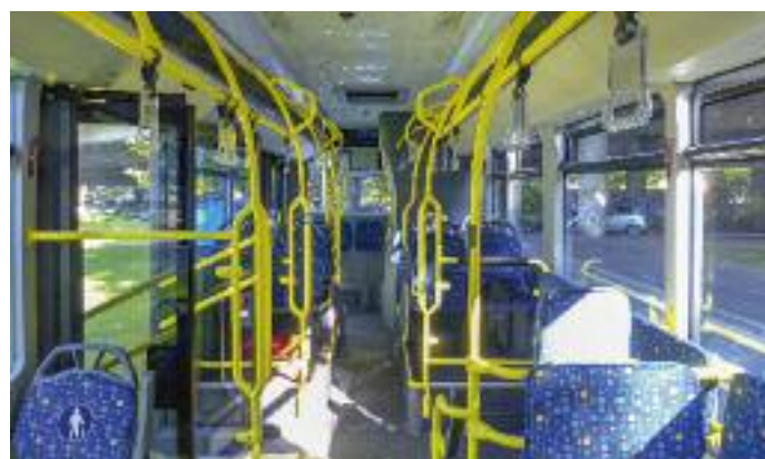
↗ 24 Sitzplätze plus 3 Klappsitze und 75 Stehplätze – so lauten die Daten zur Kapazität des Stadtbusses