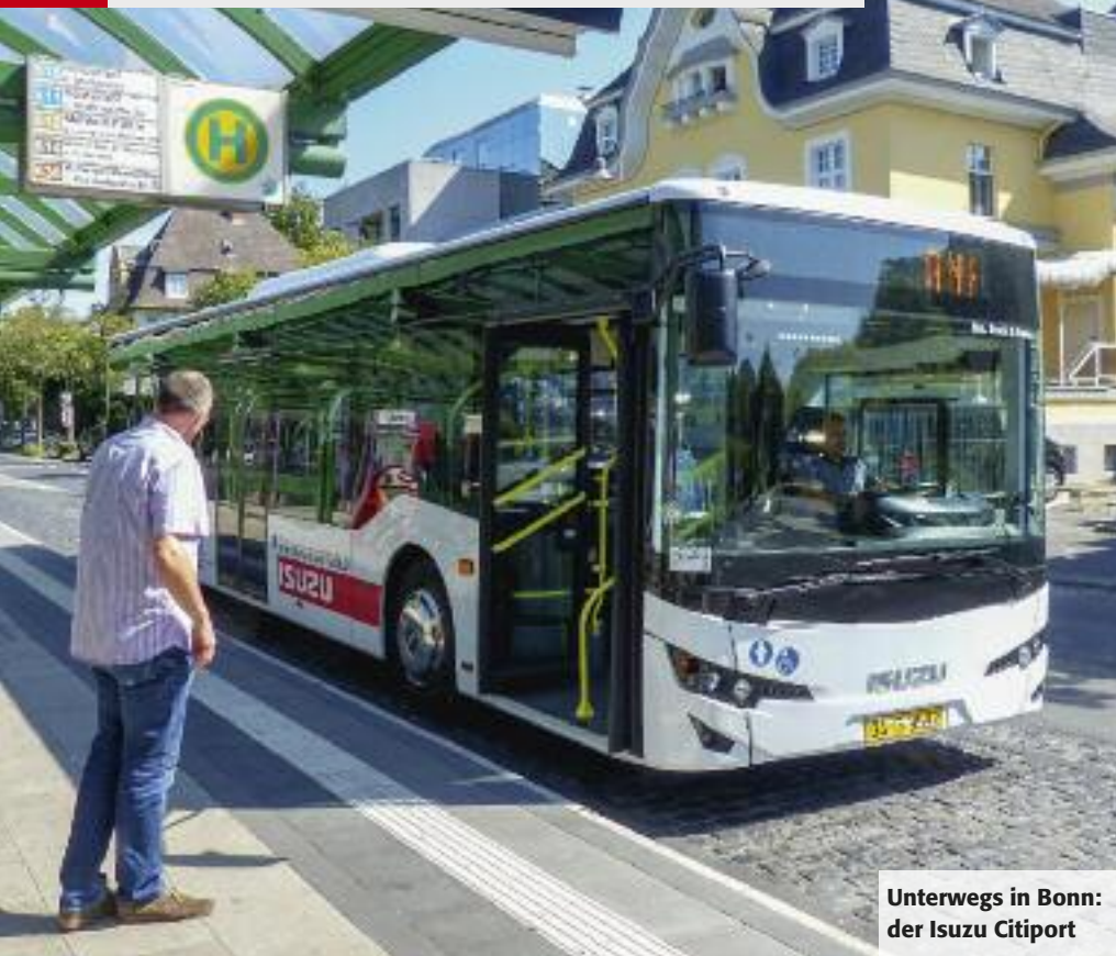
Unterwegs in Bonn: der Isuzu Citiport