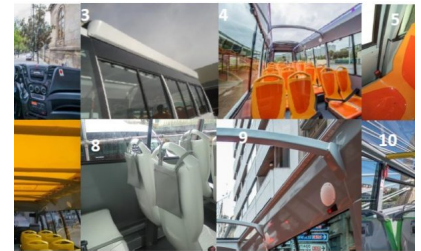
ent 25+C+1PMR "VERSION GNC": empattement